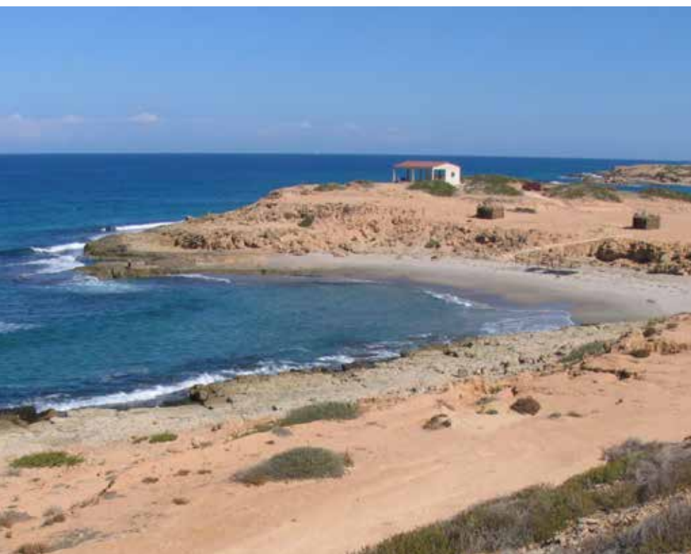
Fig. 5 - Casa sulla Villa dell'Odeon Marittimo.

L'assenza di strutture produttive costiere suggerisce che eventuali impianti per la lavorazione del pesce potrebbero essere rintracciati sotto le dune o nell'immediato retroterra, richiedendo ulteriori scavi. Le ricerche, interrotte nel 2002 per mancanza di fondi, ripresero nel 2010 con un nuovo programma di indagini, poi sospeso a causa degli eventi drammatici del 2011 e della successiva instabilità politica. La pandemia di Covid19 ha determinato, infine, un ulteriore arresto delle attività.