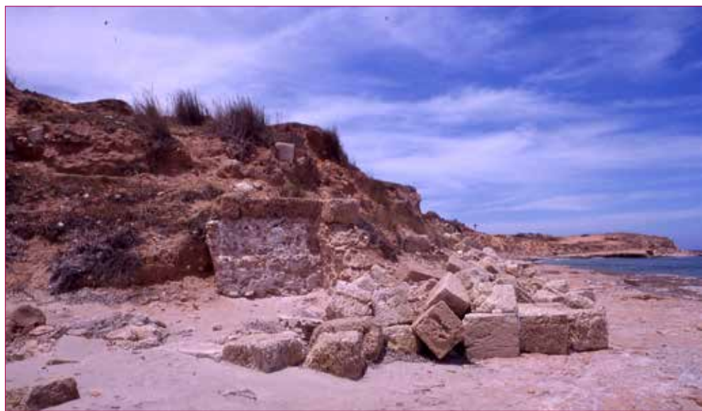
Fig. 4 - Costa di Al-Allus .

Durante la missione del 2010 è stato constatato un avanzato processo di trasformazione della costa, dovuto a massicce operazioni di escavazione meccanica, per la costruzione di strutture turistiche e residenziali. Tali interventi, iniziati probabilmente uno o due anni prima, hanno comportato la rimozione di ampie porzioni di litorale, lo spianamento delle colline e l'accumulo di grandi quantità di terreno verso il mare, alterando in modo irreversibile il paesaggio. In queste aree non è stato possibile recuperare materiali archeologici, se non nei tagli già esposti.