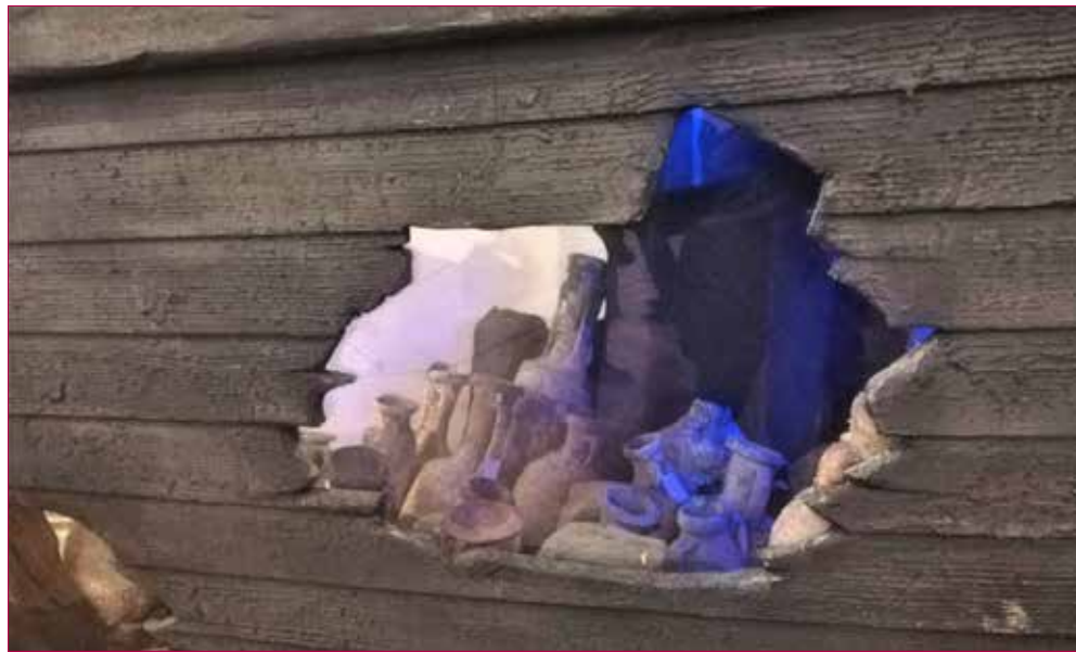
Ricostruzione di una nave con il suo carico per la mostra Sebastiano Tusa una vita per la cultura.

Un esempio virtuoso di collaborazione istituzionale è la sinergia tra la Fondazione Sebastia-