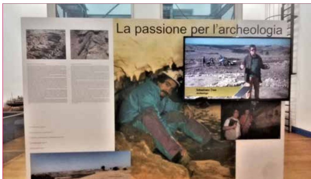
Particolare della mostra "Sebastiano Tusa una vita per la cultura"

L'opera di Sebastiano Tusa è stata determinante anche nel consolidamento del dibattito sulla Convenzione UNESCO per la Protezione del Patrimonio culturale sottomarino del Mediterraneo, avviato in occasione di due importanti conferenze tenutesi a Palermo e Siracusa nel 2001 e nel 2003. Tale impegno ha contribuito alla definizione e alla ratifica, avvenuta a Parigi nel novembre 2001, delle norme fonamen-