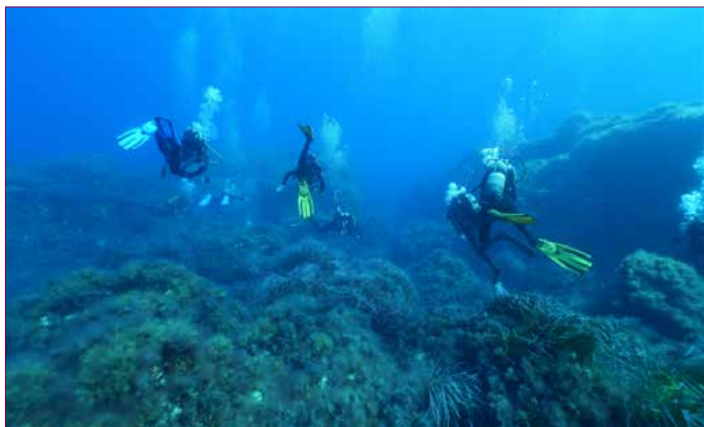
Itinerario sommerso di Cala Minnola, Favignana.

nale, il progetto più innovativo curato da istituzioni, musei e o parchi archeologici, il riconoscimento alla carriera e il miglior contributo giornalistico alla divulgazione culturale. Nell'edizione più recente la Fondazione Sebastiano Tusa ha presentato la "Rete del Patrimonio sommerso", progetto presentato con il Ministero del Turismo di Cipro, la Fondazione Mont'e Prama, il MiC, l'Università degli Studi di Palermo,