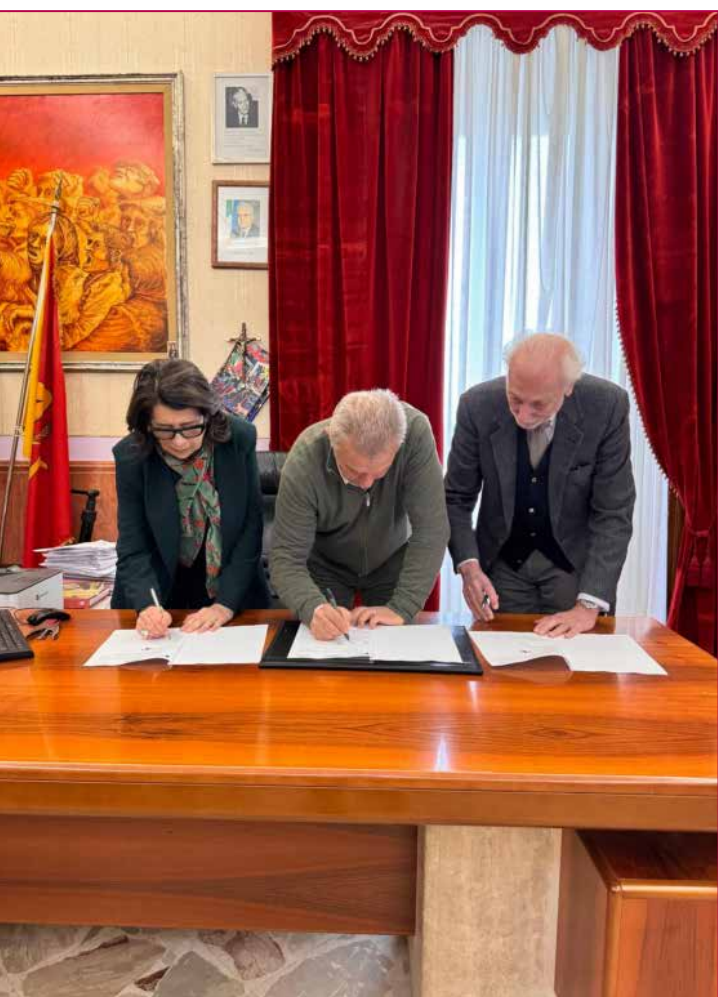
Firma della convenzione tra La Fondazione e il Comune di Partanna.

Sebastiano Tusa ha costituito un gruppo di lavoro volto all'avvio della mappatura del Patrimonio Sommerso, nella convinzione che la conoscenza rappresenti il primo e imprescindibile passo per la tutela. Tale progetto prese avvio con la fondazione del Gruppo d'Indagine Archeologia Subacquea Siciliana , divenuto successivamente Servizio Coordinamento Ricerche Archeologia Sottomarina Siciliana formato da un nucleo di studiosi e tecnici altamente qualificati, accomunati dalla passione per il mare e per l'archeologia subacquea, e guidati dall'entusiasmo e dalla visione di Sebastiano Tusa. Attraverso il sistema georeferenziato SIT , ogni intervento di scavo è gestito mediante il sistema GIS/SIT (Geographic Information System e Sistema Informativo Territoriale) che consente la foto-registrazione digitale dei contesti, la correzione planimetrica e la caratterizzazione archeologica. Tale metodologia è costantemente