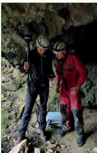
Fig. 3 - La tecnologia SLAM consente di effettuare rilievi in movimento anche in ambienti angusti e in assenza di segnale GNSS, come all'interno di una grotta.

sione acquisita viene registrata rispetto alla precedente, si assiste ad un accumulo dell'errore e ad una deriva della traiettoria, che porta a visibili errori nella mappa, come evidenziato in Figura 2. Risulta quindi fondamentale determinare le cosiddette "chiusure dell'anello" (loop closure), individuando cioè zone dell'ambiente circostante già mappate in precedenza, che consentono di imporre ulteriori vincoli e di ridurre (e redistribuire) l'errore. Una volta costruito un grafo che tenga conto anche dei vincoli imposti dalle chiusure dell'anello, un sistema di ottimizzazione consente di trovare la configurazione migliore, minimizzando i disallineamenti tra le varie scansioni (Grisetti et al., 2010). Oltre agli approcci LiDAR SLAM, non vanno dimenticati anche i metodi Visual SLAM, in cui il sensore impiegato è una fotocamera. In questo caso, la trasformazione relativa tra due pose successive è individuata a partire da algoritmi di image matching. Negli ultimi anni, la geomatica ha saputo far propri questi metodi, adattandoli alle esigenze