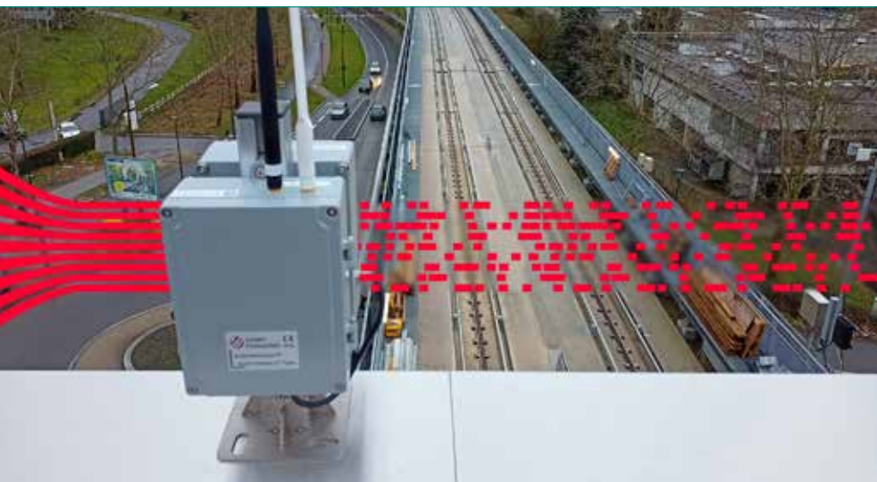
FIG. 4 - La costruzione di ponti e tunnel in Francia richiede il monitoraggio di ferrovie e piattaforme con metodi ibridi per la raccolta dati in tempo reale e la massima sicurezza.

viari continuino in sicurezza con il minor numero possibile di interruzioni durante i lavori di costruzione adiacenti. Considerando che molti progetti di sviluppo durano anni, sistemi di monitoraggio efficaci forniscono un modo per raccogliere continuamente dati sulla deformazione con la minima quantità di lavoro manuale sul binario.