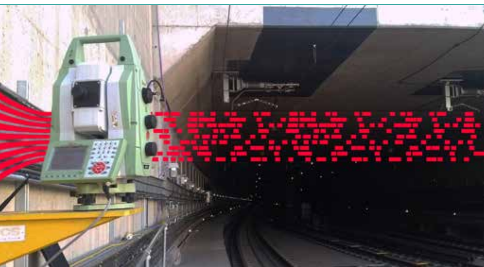
FIG. 5 - Monitoraggio della sicurezza dei tunnel e dei treni sotto la stazione di King's Cross nel Regno Unito con un software per analizzare e visualizzare dati in tempo reale provenienti da più fonti.

Leica Geosystems hanno una qualità costruttiva robusta che consente l'uso dello strumento. Aiuta a funzionare in modo autonomo più a lungo senza bisogno di manutenzione e telecamere che forniscono scorci