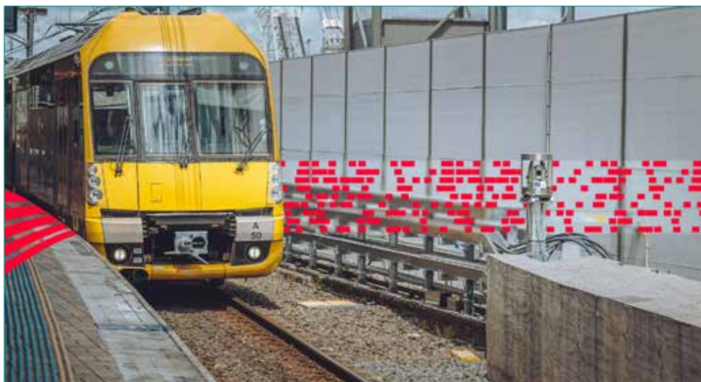
Fig. 2 - La soluzione di monitoraggio ferroviario rende possibile la continuità del trasporto ferroviario nel contesto di importanti lavori di costruzione in Australia.

La stazione totale di monitoraggio Leica TM60, ad esempio, è una stazione totale automatizzata ad autoapprendimento progettata per il monitoraggio che soddisfa i requisiti di misurazione 3D più esigenti. Le