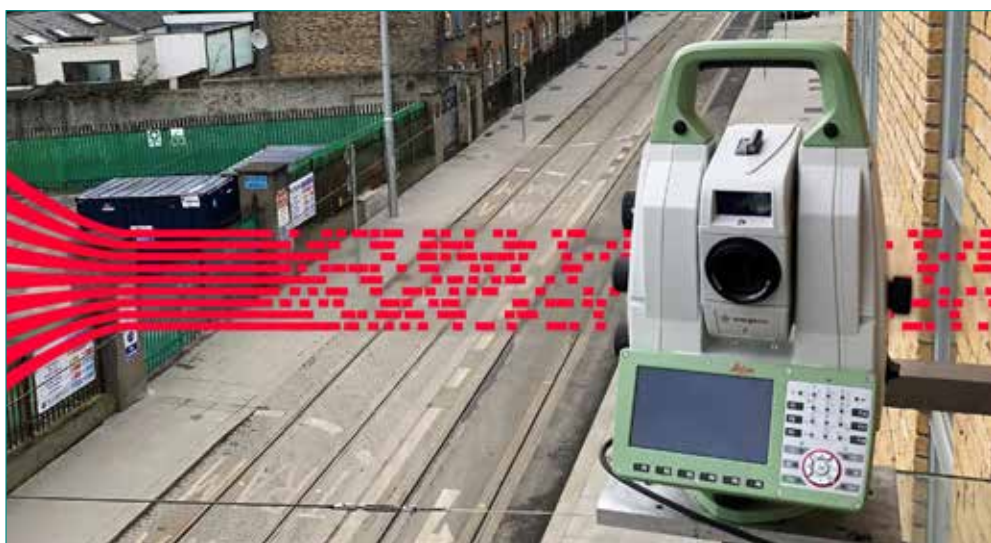
FIG. 3 - La stazione totale di scansione consente misurazioni continue in modo che il sistema di metropolitana leggera di Dublino possa funzionare senza interruzioni.

Per gli operatori ferroviari è importante che i servizi ferro-