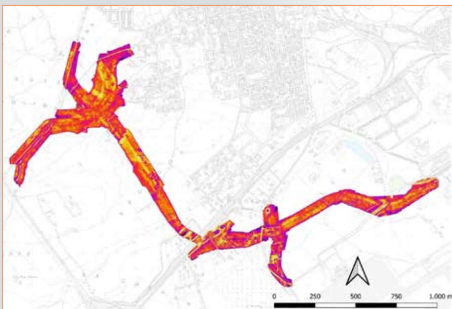
Fig. 3 - PFTE Collegamento aeroporto di Olbia. Mappa termica.