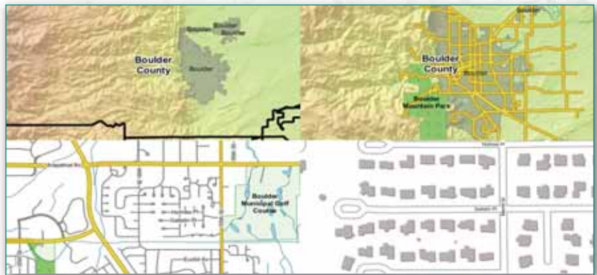
Fig. 1 - Esempio di rendering avanzato di mappe con Geoserver.

La release 2.3.0. di GeoServer è adesso disponibile da scaricare e testare secondo la filosofia release early, release often . Ecco le principali novità della nuova versione.