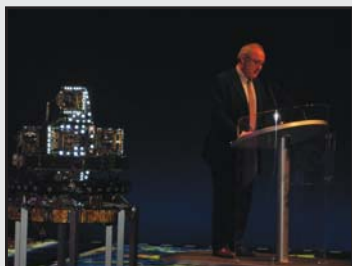
Il Direttore Generale dell'ESA, Jean-Jacques Dordain, dà il benvenuto agli intervenuti all'evento organizzato per il lancio di GOCE.

Quest'ultima è stata raggiunta il 6 aprile, data in cui il motore a ioni del satellite è stato acceso per controbilanciare la infinitesima, ma non nulla, forza di attrito dovuta alla bassa quota di volo (273 Km) del satellite. E l'8 aprile l'EGG è stato attivato iniziando a fornire i primi dati scientifici e a modulare allo stesso tempo la spinta del motore a ioni in funzione delle accelerazione misurata nella direzione di volo, al fine di mantenere le condizioni di una ideale caduta libera.