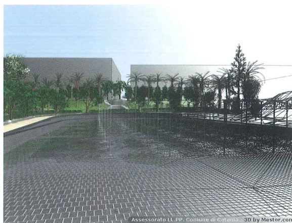
Figura 6 - Immagine artistica ottenuta combinando la vista progettuale con quella di rendering.

I benefici della discretizzazione si constatano sin dalla fase progettuale: l'analisi del progetto in 3D consente di avere una conoscenza globale di tutto il progetto, in tutte le particolarità. La rappresentazione tridimensionale permette di osservare e studiare l'oggetto in esame da ogni possibile punto di vista ed angolazione, di effettuare misurazioni, di estrapolare informazioni non deducibili dalla rappresentazione bidimensionale. Il 3D facilita l'accertamento, l'analisi e la correzione di eventuali errori progettuali, limitando i costi dovuti a realizzazioni errate, e consente di visualizzare e controllare l'aspetto finale di un progetto, o di un prodotto, di verificarne la bontà durante l'iter progettuale, senza la necessità di realizzarne alcuna parte o eventuali prototipi. Al contempo, si manifestano i benefici, derivanti dalla virtualità, che afferisco-