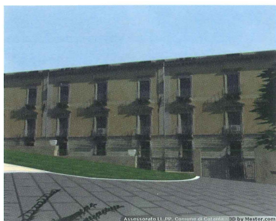
Figura 4 – La mappatura di texture fotografiche dà un elevato grado di realismo e contestualizzazione alla scena.

I file di output derivanti dal processo di rendering sono stati elaborati per produrre formati diversi al fine di disporre di animazioni ed immagini di alta qualità, ma di grandi dimensioni, e di animazioni ed immagini di qualità inferiore più facilmente fruibili. La fase di post-produzione ha incluso l'editing, tecniche di regia, integrazione di brani musicali e commenti vocali, la replicazione del