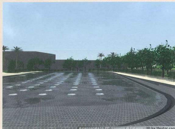
Figura 3 – Rendering di due scene con tutti i parametri fisici che incidono sulla simulazione di fontane ed acqua.

esatta posizione geografica. Parallelamente, sono state scattate diverse fotografie ai palazzi che circondano il giardino Bellini. Le fotografie in formato digitale sono state trattate con Photoshop della Adobe e Paint Shop Pro di Jasc Software. Le texture ottenute sono state applicate ai modelli degli edifici raggiungendo così un elevato grado di realismo e di contestualizzazione.