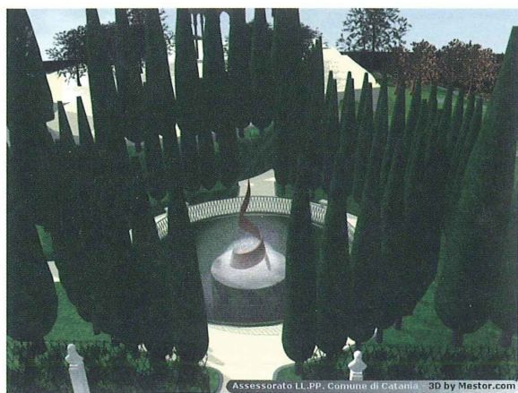
Figura 2 – Esempio di matte painting 2D utilizzati per rappresentazioni stilizzate di tipo "artistico".

Al fine di contestualizzare il modello, sono stati importati i layer geografici gestiti tramite Autodesk Map, relativi alla rete viaria cittadina ed all'urbanistica della città. La georeferenziazione di tutti gli elementi in gioco ha permesso di inserire il modello 3D del giardino Bellini nel contesto urbano, nella sua