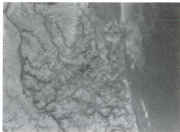
Una delle primissime immagini viste durante la lunga notte di Huygens. Presa da circa 16 Km di altezza ha una risoluzione di circa 40 metri per pixel. Si notano canali di scorrimento di liquidi ed un confine tra due zone di diverso tipo.