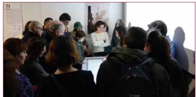
Fig. 11 - Consultazione da parte del pubblico dei contenuti del Living Lab in occasione di un evento di promozione culturale.

Sin dalla sua inaugurazione, il Catania Living Lab ha accolto molti visitatori a dimostrazione del ruolo di grande attrattore che questa struttura esercita nel promuovere una forte attività di educazione al patrimonio culturale, andando così a colmare un gap nel panorama dell'offerta locale (Fig. 11). Il Catania Living Lab non può e non deve essere solo uno spazio per esplorare contenuti di grande rigore scientifico ma è soprattutto un ambiente all'interno del quale generare condivisione. La sfida di oggi è di configurare spazi e progettare nuove modalità per comunicare la cultura per accrescere la curiosità del visitatore e del turista ma soprattutto creare un nuovo sodalizio tra il passato ed i nuovi strumenti e modalità di fruizione dei contenuti, ricoprendo sempre più il ruolo di soggetti attivi e sempre meno quello di spettatori passivi. Proiettare la città di Catania ed il suo patrimonio in una dimensione sempre più all'avanguardia e capace di produrre un impulso sostanziale alla diffusione della conoscenza dei beni culturali è operazione non facile. Il Catania Living Lab si configura come luogo ideale di partenza dal quale proseguire questo interessante esperimento verso importanti traguardi. (D.M.).