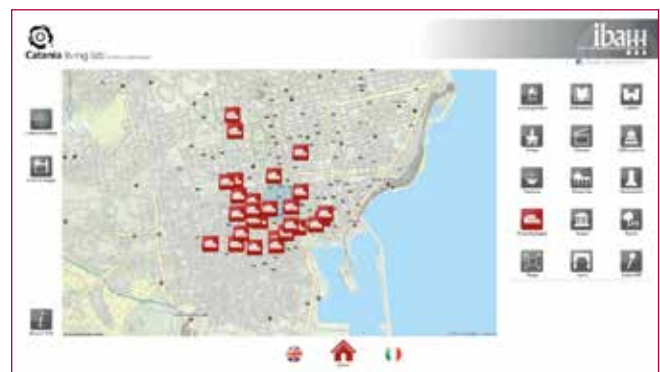
Fig. 8 - Interfaccia grafica di primo accesso ai contenuti della Totem App.

scientifico degli archeologi e ricercatori delle sedi IBAM di Catania e Lecce, pone i riflettori sull'anfiteatro romano restituendo alla comunità etnea, attraverso un'immagine evocativa di grande effetto, uno dei monumenti più importanti della città, ormai quasi del tutto inglobato nel moderno tessuto urbano. (G.M.).