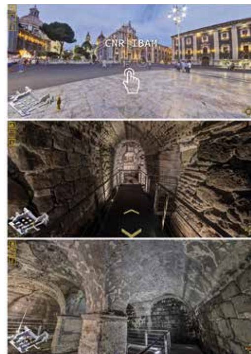
Fig. 9 - Esempio schermata di accesso e navigazione della Galleria immersiva delle Terme Achilliane.

Promuovere, educare e coinvolgere. Questi i principi su cui si fonda il laboratorio di cultura e tecnologia. Al fine di poter perseguire tali obiettivi e stimolare in modo continuo l'interesse verso il Catania Living Lab, lo staff del laboratorio ha pianificato una fitta programmazione di eventi di promozione e divulgazione.