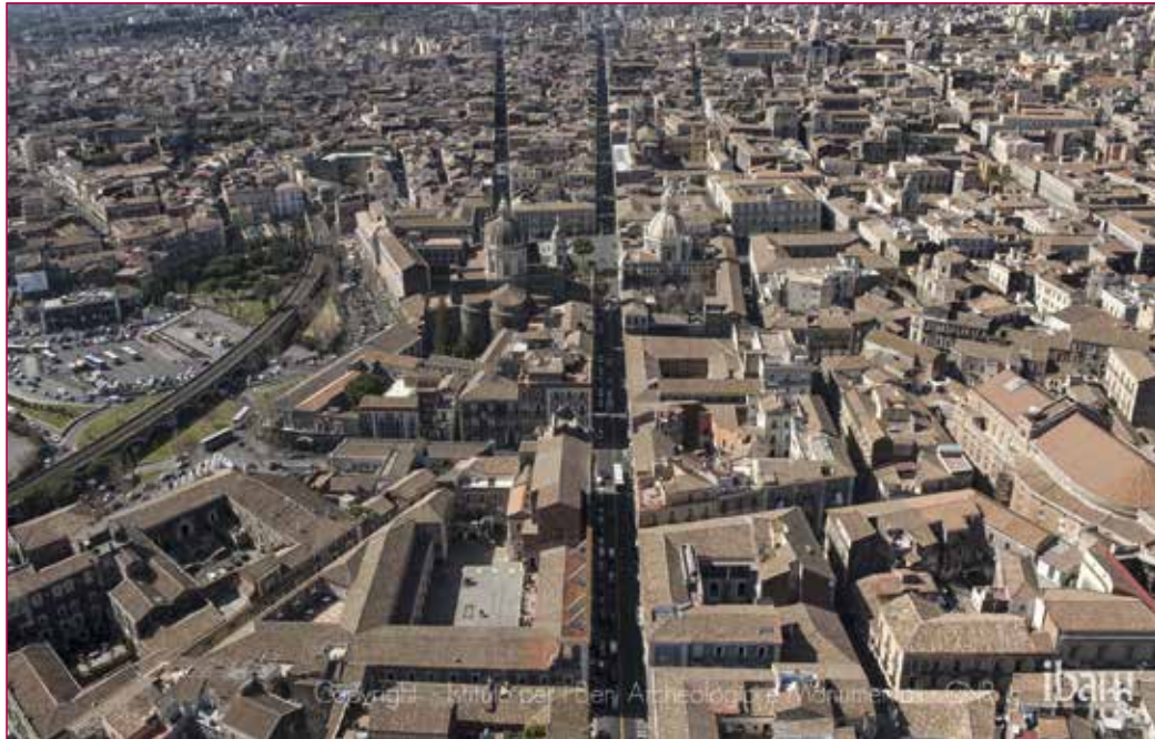
Fig. 1 - Veduta aerea di Piazza Università, centro storico di Catania (Autore Giovanni Fragalà).

Il sistema beni culturali o cultural heritage nell'accezione anglosassone è entrato da tempo all'interno di una sempre più sentita riorganizzazione concettuale che investe sia i modelli di conoscenza e fruizione che l'ideazione di servizi ed esperienze in grado di soddisfare una sempre crescente richiesta di cultura mista ad intrattenimento ed interattività.