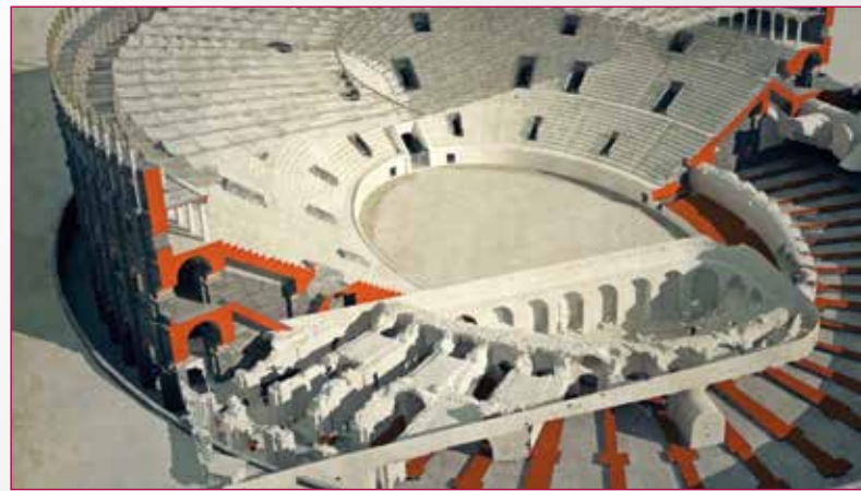
Fig. 7 - Sezione ricostruttiva dell'anfiteatro romano di Catania con indicazione delle strutture oggi superstiti.

La realtà virtuale, oltre ad offrire migliori opportunità di apprendimento e una più concreta percezione del dato immateriale, costituisce ad oggi il più alto livello di interazione tra uomo e sistemi informatici, garantendo al fruitore non solo un coinvolgimento emotivo maggiore ma anche la possibilità di accedere al bene e alla sua storia attraverso modalità e punti di vista nuovi, rendendo talvolta "visibile l'invisibile". La modellazione 3D consente, ad esempio, di svelare tra ipotesi e conferme, l'aspetto originario di un monumento. "La città nascosta: l'anfiteatro romano di Catania", la prima proposta ricostruttiva fruibile al Catania Living Lab, realizzata dal team IBAM ITLab con il supporto