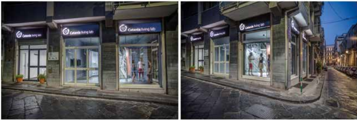
Fig. 2 - Catania Living Lab: vista dall'esterno (Autore Danilo Pavone).