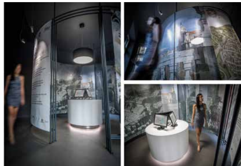
Fig. 3 - Catania Living Lab: spazi e allestimento interni (Autore Danilo Pavone).

Accanto a schermi LED dinamici e diaframmi statici semi-trasparenti, per connotare l'esperienza di questo spazio di un'atmosfera ancora più suggestiva il pavimento, le pareti ed il soffitto sono stati trattati con resine e pitture tattili di