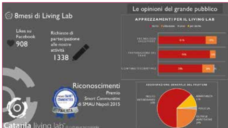
Fig. 10 - Grafico dell'impatto quantitativo e qualitativo del pubblico raggiunto.

Emerge con il 90% l'apprezzamento del pubblico legato alla preparazione del team, seguito, con una percentuale dell'81%, a quello relativo alle tecnologie sviluppate. In definitiva, il 63% dei visitatori si ritiene molto interessato al Catania Living Lab e il 24% ha dichiarato che l'esperienza vissuta durante l'evento serale è andata oltre le aspettative (Fig. 10). (S.I.).