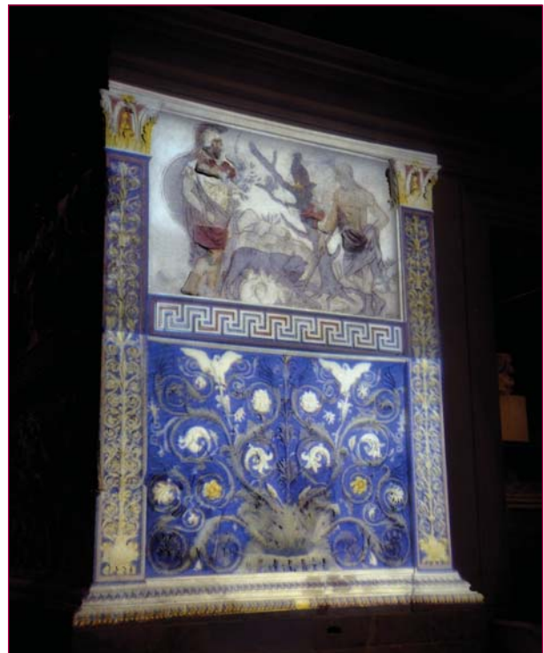
La prima proiezione di colore realizzata stampando vetri colorati (gobos).