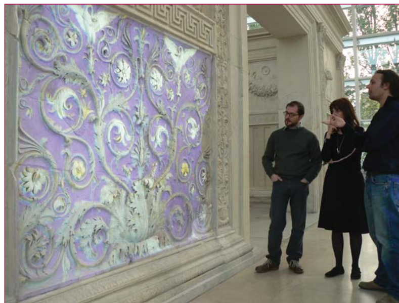
Prima prova proiezioni di colore