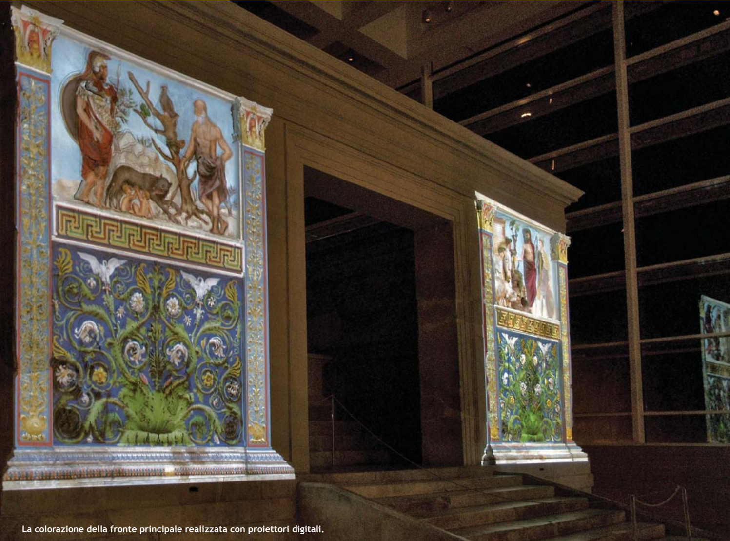
La colorazione della fronte principale realizzata con proiettori digitali.

Una appassionata narrazione che ha trasformato un progetto tecnico in un'esperienza emotiva: restituire una veste cromatica all'Ara Pacis Augustae. Studiosi, ricercatori, tecnici, aziende e l'amministrazione comunale hanno messo in campo singole competenze per il perseguimento di un obiettivo comune: vedere i colori animare i rilievi, stendersi su di essi, accompagnarne le pieghe e dare di queste sculture famose un'immagine del tutto nuova.