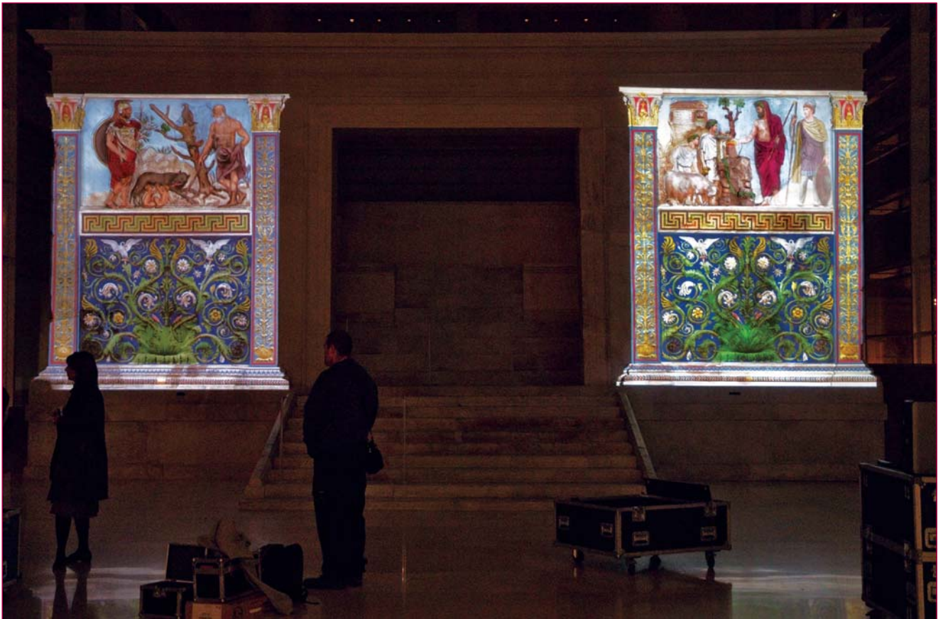
Prove di proiezione con videoproiettori digitali.

devamo ci persuadeva ad andare avanti: ci proponemmo di realizzare per il 23 settembre di quello stesso 2008, in coincidenza con il giorno natale di Augusto, una proiezione di colore su tutta la facciata principale del monumento, circa 50 m 2 di rilievo di altissima qualità artistica, su cui proiettare la nostra ipotesi cromatica.