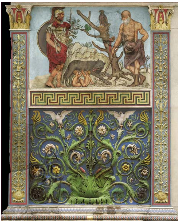
L'immagine colorata da A. Merante per il pannello del Lupercale.

Il pannello di 'Enea che sacrifica ai Penati' e il 'Lupercale' con Faustolo, Marte e i gemelli, venivano ripresi da una di-