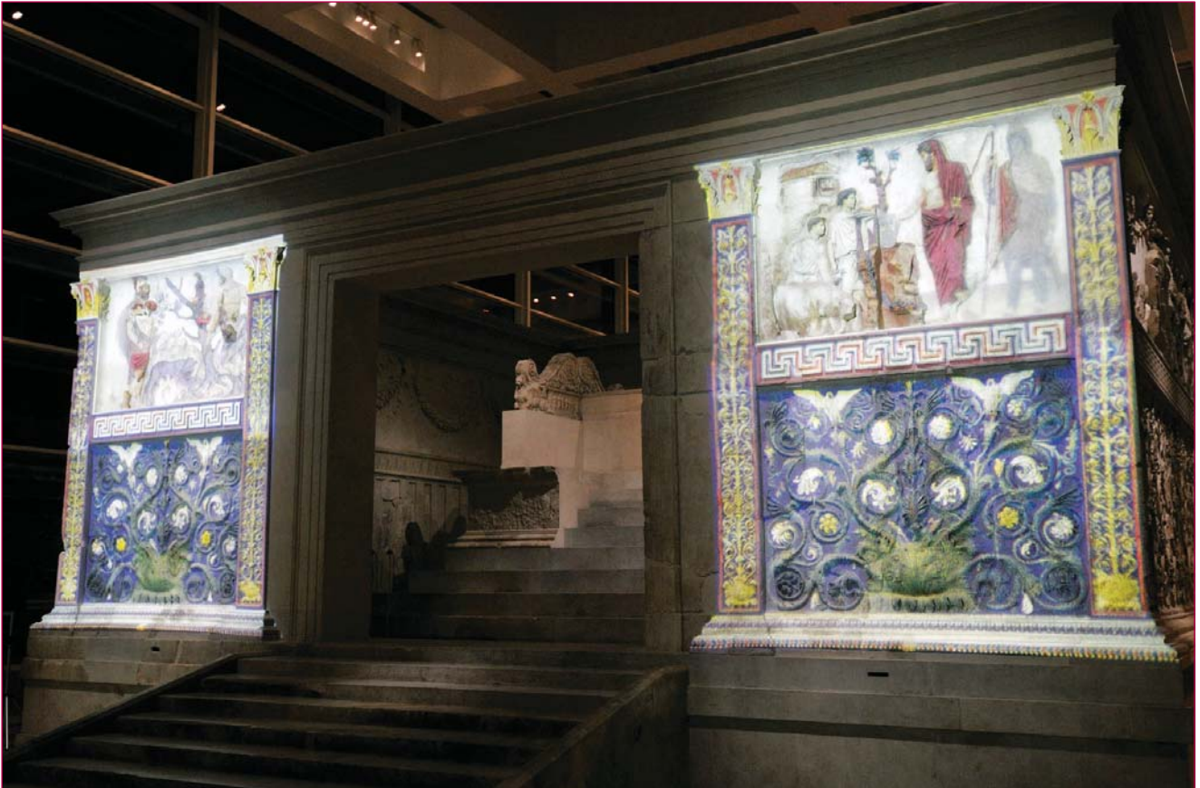
La proiezione realizzata il 23 settembre del 2008.

seconda fase del lavoro. Insieme con G. Zanzi - archeologo della Sovrintendenza che ha curato la regia delle riprese fotografiche poi realizzate da S. Castellani - decidiamo di eseguire quattro scatti perfettamente ortogonali al centro dei quattro pannelli sulla fronte principale del monumento.