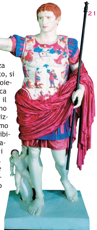
Il calco colorato dell'Augusto di Prima Porta.

Certamente un'immagine straniata, per certi versi irreali, anche perché il gobos realizzato non traduceva esattamente il colore naturalistico (i tralci verdi, il fondo blu) dell'immagine virtuale consegnata, ma pure bellissima. Sedotti dal colore e confortati dal successo, capimmo però subito che molto andava migliorato e che restavano molte incognite. Prima fra tutte: cosa sarebbe successo proiettando l'immagine a colori sulla fronte principale del monumento da una distanza che doveva essere necessariamente maggiore, quasi doppia, se volevamo che il pubblico potesse ammirare la visione d'insieme a colori, ad esempio, del pannello di 'Enea che sacrifica ai penati' e di quello sottostante con il fregio vegetale? E in secondo luogo: con le scarse risorse a disposizione - praticamente ogni costo, in quella prima fase, ricadeva sulla generosità dello sponsor - saremmo riusciti a costruire un supporto adatto a posizionare due diversi proiettori (peso unitario di circa 40 kg) esattamente uno sull'altro, ad una distanza tra loro e ad un'angolazione tali che le due immagini proiettate coincidessero perfettamente nel punto di giunzione? Le incognite rimanevano, ma quello che ve-