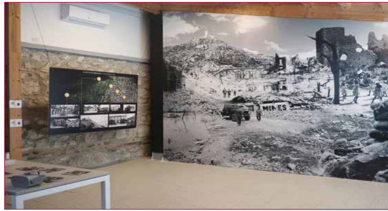
Fig.5-Photocollage 450*350 cm realizzato compositando 20 fotografie di archivio storico.