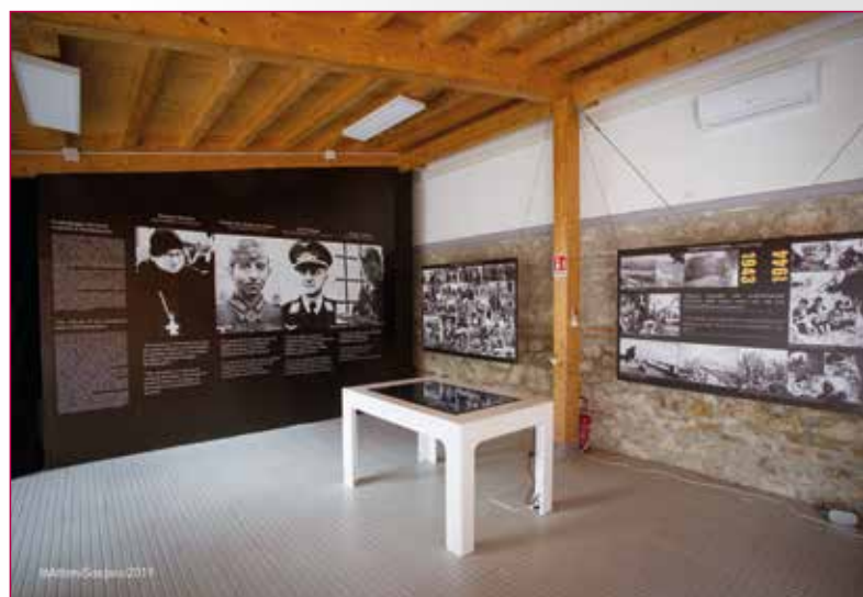
Fig. 3 - Attimi sospesi, Sala A: tavolo touch, pannelli informativi e fotografici.

Lo spettacolo Frammenti, invece, è stato messo in scena in prima nazionale con due repliche per l'inaugurazione dell'allestimento temporaneo.