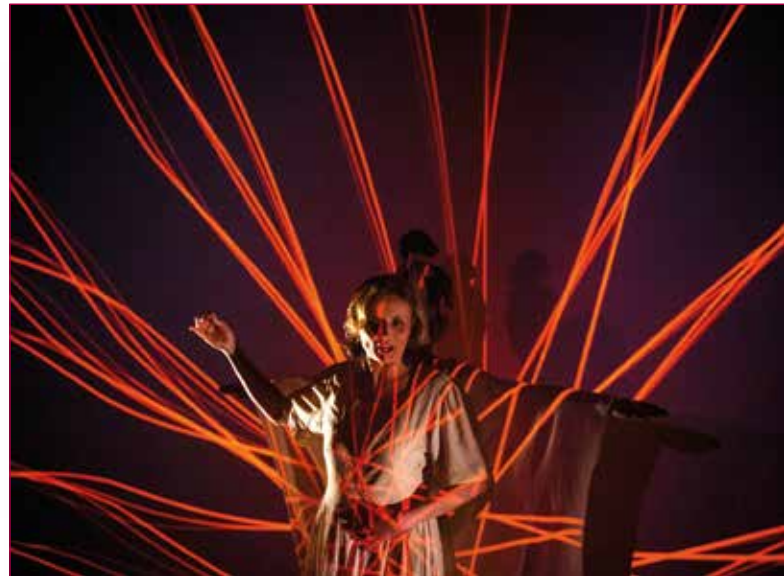
Fig. 2 - Spettacolo "Frammenti".

Un dialogo costruito a più voci, tratto dai singoli diari, interviste, biografie di quattro protagonisti: Frido von Senger und Etterlin, generale Tedesco, Julius Schlegel ufficiale della Wehrmacht, Divisione Corazzata "Herman Göring", L'Abate dell'Abbazia di Montecassino Gregorio Diamare e il Monaco Eusebio Grossetti.