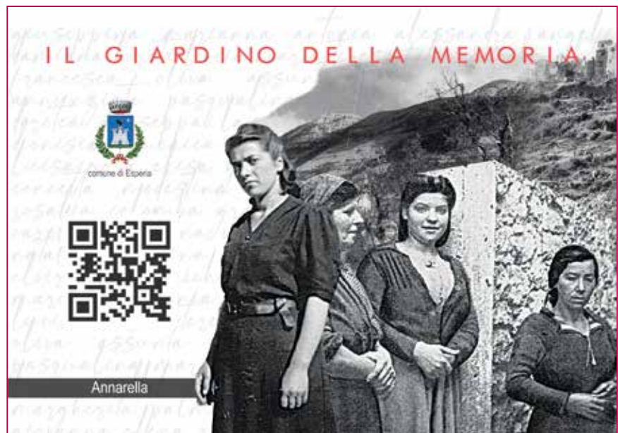
Fig. 1 - Giardino della Memoria, targa interattiva.

Ricerca, storytelling e nuove tecnologie per conservare e tramandare la memoria di un territorio. Due progetti: il Giardino della Memoria ad Esperia e l'Allestimento Attimi Sospesi a Cassino.